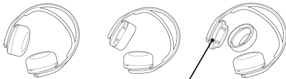
Етикет с характеристики

За да поставите уплътнението обратно, подравнете го с вътрешната рамка. Натиснете го назад върху рамката, докато се разположи на място